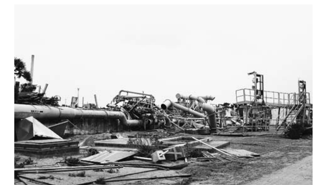
津波で設備が被害を受けた宮城県岩沼市の下水処理場