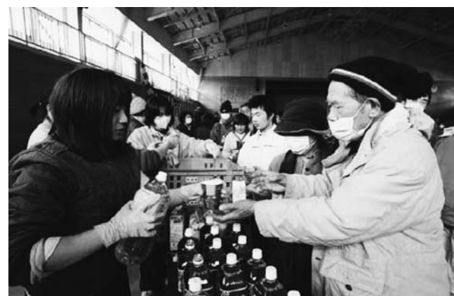
避難所では食料や衣類が行き届いているが、風呂やトイレ設備は不十分だ

コンテナは、いわば鉄の箱なので夏暑く、冬は寒くなる。そこで、夏場の厳しい日差しや冬場の冷え込みを大幅に緩和させる遮熱・断熱塗料「シポフェース」を2、3日かけてコンテナの外壁と屋根に吹き付けた。5月上旬にコンテナ用運搬車で被災地に3個輸送、現地で活用されている。塩谷社長は「震災が起き、復興支援のために何が出来るかと考えた時、遮熱塗料と断熱塗料を生かすべきと思った。これが我々の社会貢献。今後、現地の自治体などに需要を聞き、徐々にコンテナの数を増やしていきたい」と話す。