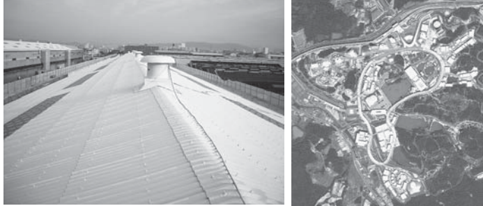
【雨音消音性能】 【愛知万国博覧会(04)ハビリアン屋根遮熱・消音施工】 ※全国500ヶ所80万㎡の施工実績あり