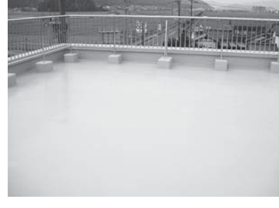
【ウレタン防水の中に断熱材を入れる工法】 ※昨年、越前市と国交省より1000万円の助成金を取得した工法です