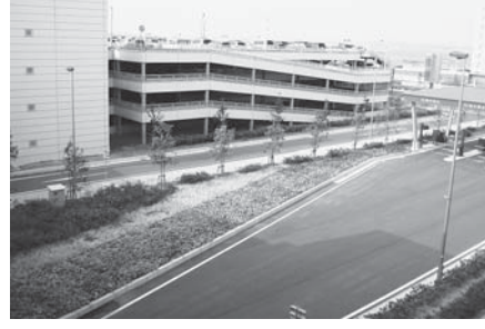
【中部国際空港ベストフローア施工】 ※大手・準大手ゼネコン施工実績あり